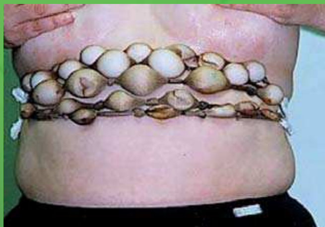
Josta ar konteineriem