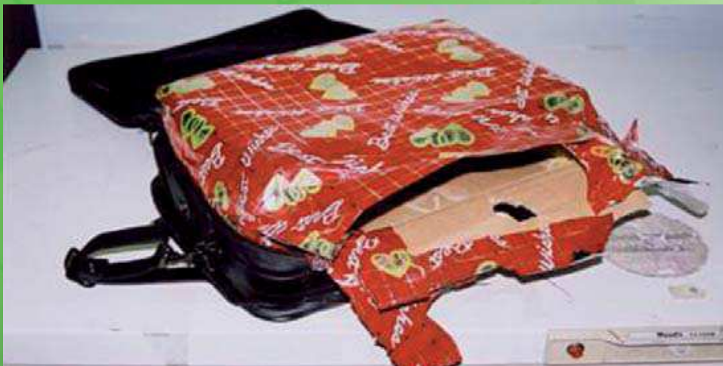
Dāvanu kaste rokas bagāžā (ievietots ērglis)